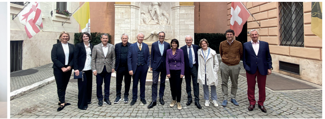
Doris Leuthard Ex Consigliera federale Presidente del Comitato di Patrocinio

Dal profondo del cuore, vi ringrazio per il vostro interesse e per la vostra disponibilità a seguire il cammino fino alla meta.