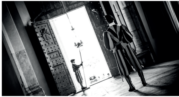
La vecchia caserma, costruita all'inizio del XIX secolo, si trovava ai piedi del Palazzo Apostolico.