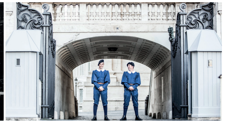
Nel 1931, la vecchia caserma fu demolita per costruire l'attuale caserma degli ufficiali di fronte alla Torre Nicholas V.