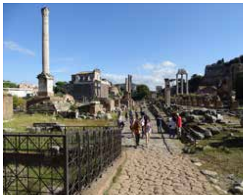
Foro Romano, Roma