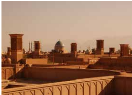
Torre del Vento, Yazd