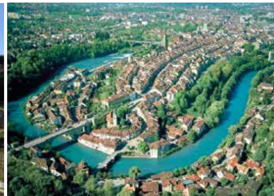
Città vecchia, Berna