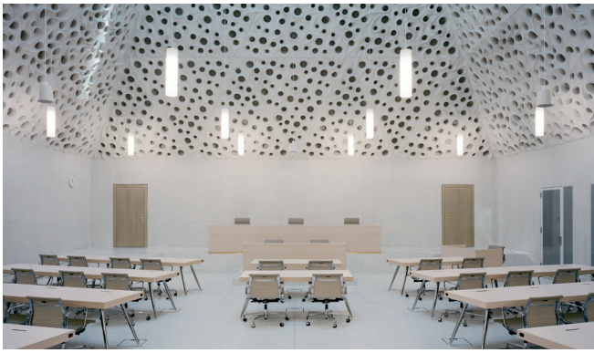
Tribunale penale federale di Bellinzona, aula di tribunale