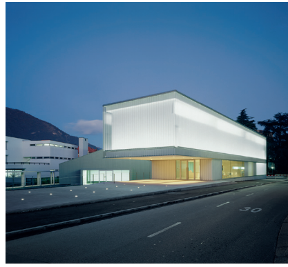
Museo Max, Chiasso