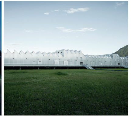
Centro di formazione professionale, SSIC, Gordola (TI)

flessione ecologica, nel senso che dobbiamo fare tutto il possibile per garantire agli abitanti del nostro pianeta una vita in equilibrio, armonia e quindi nel rispetto della natura, considerato che le sue ricchezze non sono inesauribili. È in questo spirito che concepiamo la nostra missione di costruttori.»