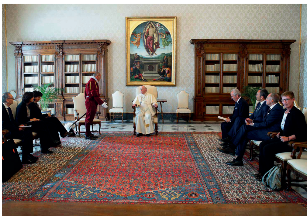
Udienza privata con Papa Francesco di una delegazione della Fondazione Caserma.