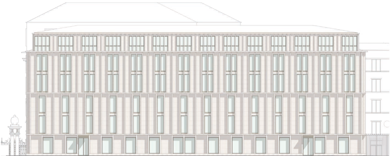
Facciata verso il Cortile dell'Olmo