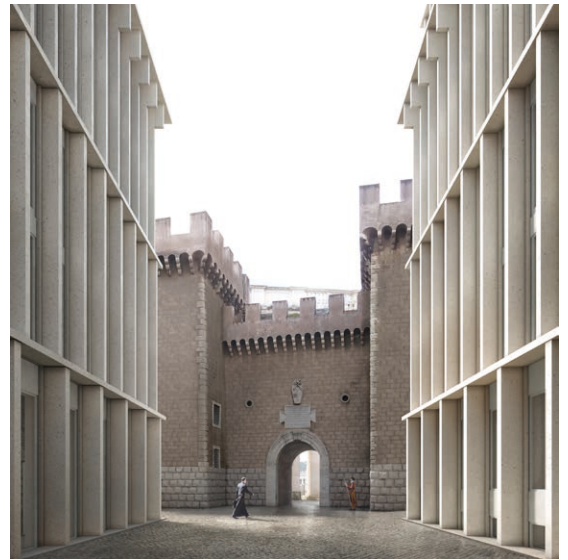
Cortile d'onore della caserma.