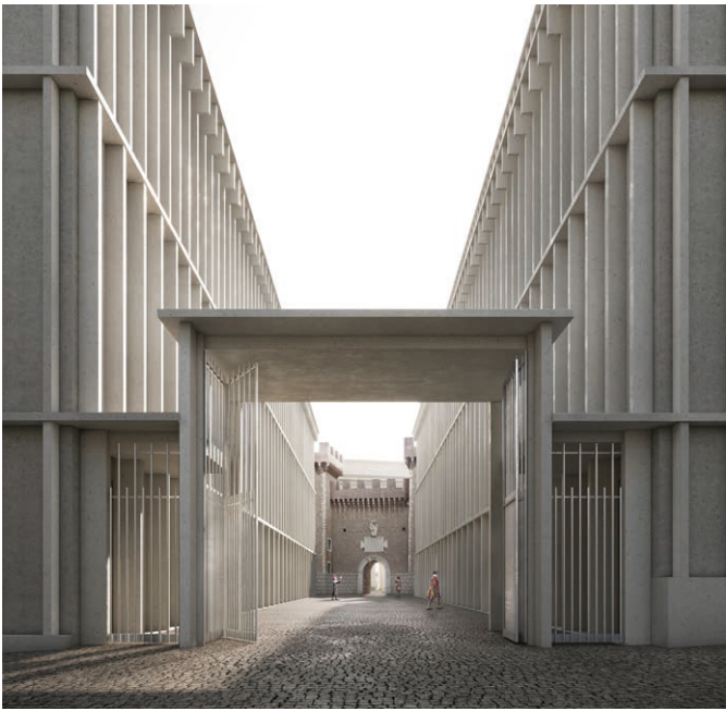
Fig. 3 Ripristino del percorso storico della «Via Francigena» mediante lo spostamento della fontana commemorativa.