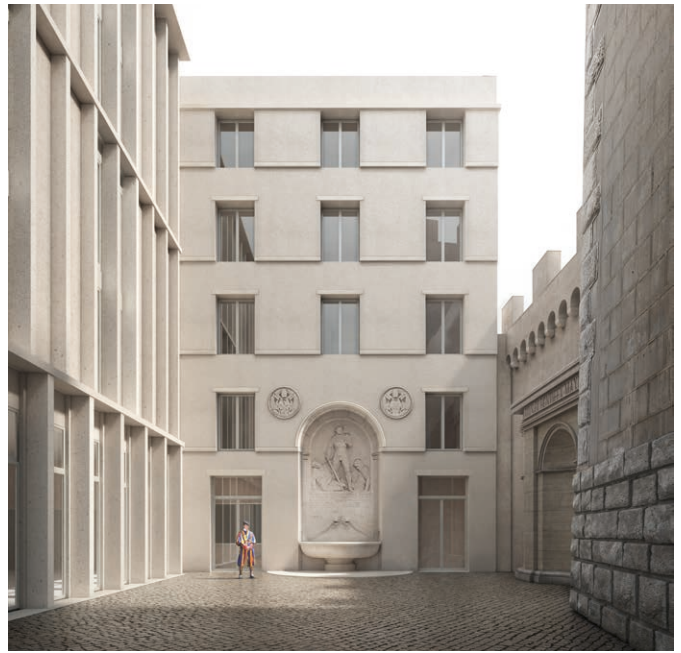
Fig. 4 Fontana nella sua posizione definitiva.