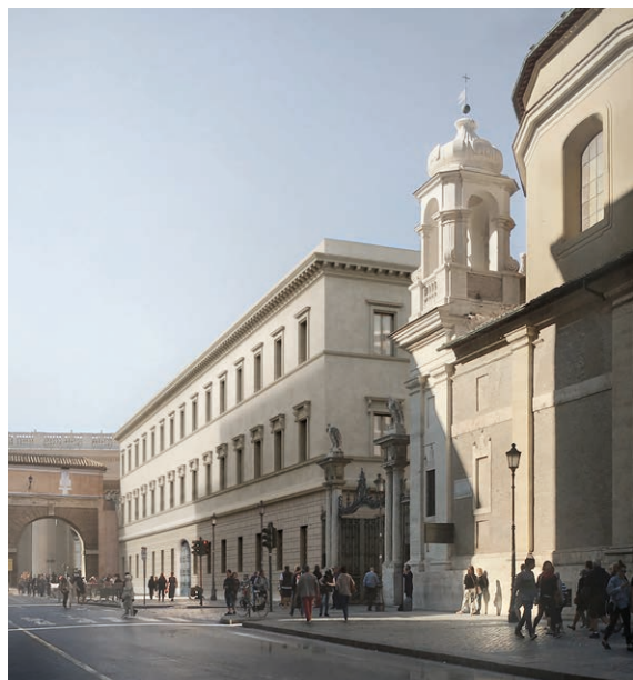
Fig. 1 Conservazione della facciata verso l'Italia

Tutte queste modifiche contemplate dal progetto richiedono complessivamente circa 9 milioni di franchi.