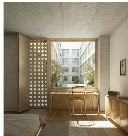
Fig. 5. Camera delle guardie

Inoltre, il progetto originale ha subito modifiche sostanziali (conservazione della facciata rivolta verso l'Italia, miglioramento del sistema interno di deumidificazione e ventilazione, risanamento della fognatura, consolidamento delle fondamenta dell'edificio). La nostra Fondazione redigerà un nuovo budget entro la fine di quest'anno.