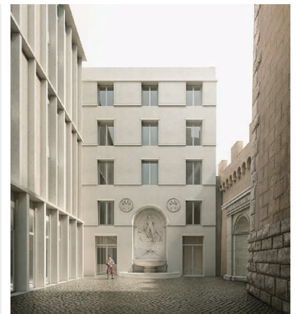
Fig. 2 Nuova ubicazione della Fontana

Negli spazi interni degli edifici sono state apportate solo poche modifiche rispetto alla pianificazione iniziale. Le reclute saranno alloggiate in camere doppie e gli alabardieri in camere singole.