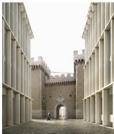
Fig. 3 Porta Sancti Petri