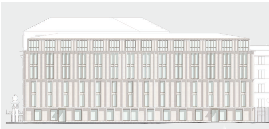
Fig. 1 Facciata verso il Cortile dell'Olmo

Oltre a ciò, gli architetti sono riusciti a incorporare in modo funzionale il piano attico, che sovrasta l'intero edificio.