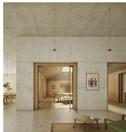
Fig. 6. Spazi comuni