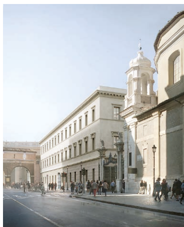
Fig. 4 Facciata storica con la Porta S. Anna